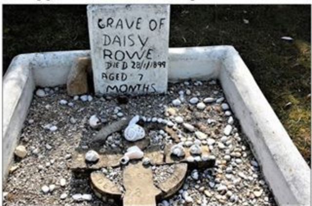
Die grafjie van Daisy Rowe, dogter van een van die vuurtoringwagters wat in 1899 oorlede is.

Alle advertensies kan soos normaalweg ingestuur word na suidernuusads@isat.co.za of skakel 028 424 1205 kantoor-ure.