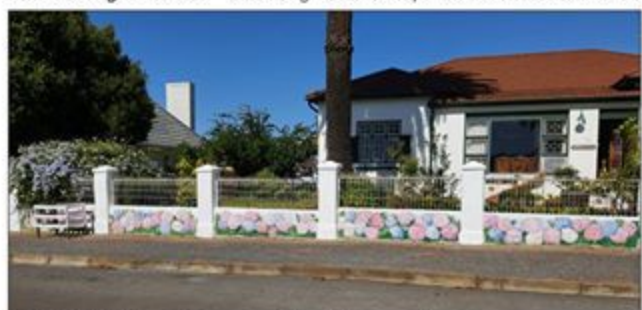
Paleishuis in Villiersstraat spog met 'n splinternuwe blommewuur.

Doen julle iets spesiaal in hierdie spesiale tyd? Vertel ons asseblief daarvan!