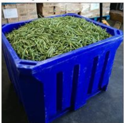
Green beans donated by a producer in Stellenbosch being collected.