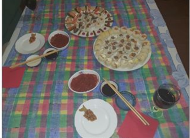
Heerlike boeresushi, wat sekerlik baie gewild gaan word.