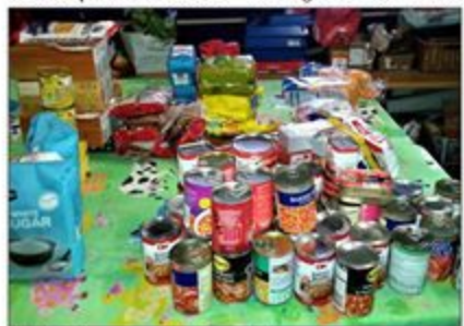
Kruidentiersware vir koskakkies.

Verpakte kos wag om saam met ander produkte in sakkies vir aflewering gepak te word.