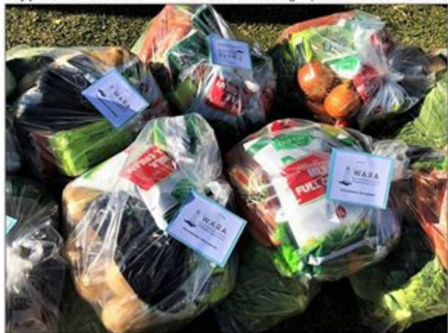
Een van die reuse pakke vars vrugte en groente wat deel van die kospakkies uitgemaak het met 'n nota aan die ontvangers van WARA.