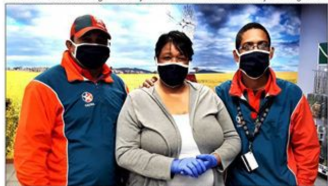
The black masks worn by Napier's Overberg Agri Garage and shop assistants remind us of movie theatre hero Zorro. The Garage shop is also "open" for business now but both garage and shop have to close at 18h00 sharp. Leaving all who forgot to "fill up" with empty petrol tanks!