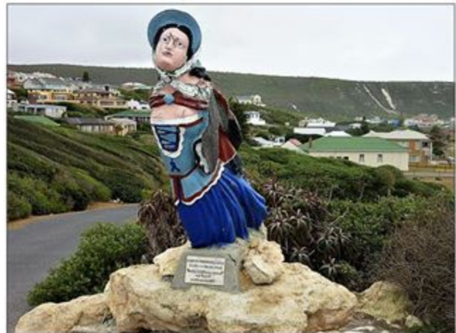
'n Replika van die oorspronklike boegbeeld wat in die Skeepsrakmuseum te sien is.