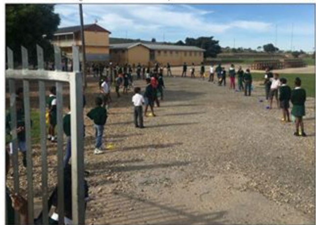
Leerders van Bontebok Primêr woon daaglik die voedingsprogram by in hul skooldrag om goeie dissipline in stand te hou.