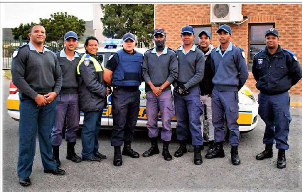
During LOCKDOWN the best part of the local work force, including those employed by the local authority, have not been "on the job". This, however, does exclude the members of the local Law Enforcement Department who have been working around the clock 12 hour shifts