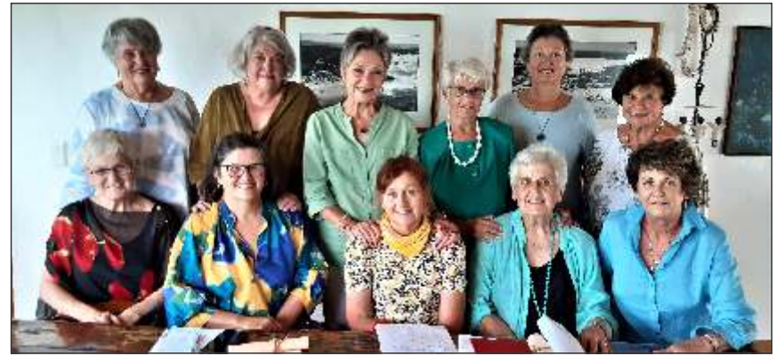
Die Bredasdorp Leeskring het hul ontmoetings vandeeweek op 15 Februarie 2022 op Waenhuiskrans afgeskop.