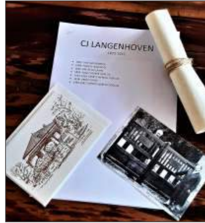
Langenhoven was 'n veelsydige skrywer.

Die reeks het begin met Langenhoven, wie se bekendste skrywe sekerlik die woorde van Die Stem sal wees. Ook taalvegter, politikus en stigter van Die Burger , was Sagmoedige Neelsie 'n veelsydige skrywer van prosa, verse,