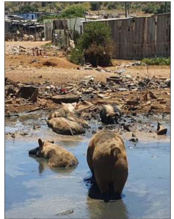
Stray pigs in the informal settlement.