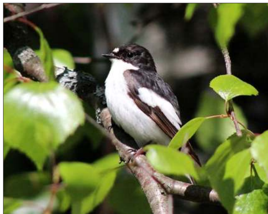
A male European pied flycatcher in Haukipudas, Finland