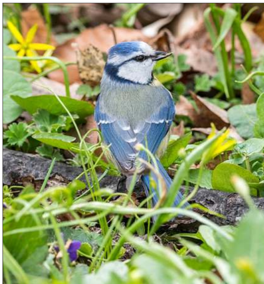
The Eurasian blue tit.

This article was originally published on the website of The Conversation Africa