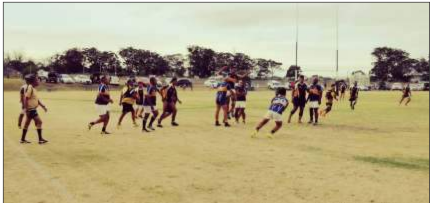
The Bredasdorp Rangers Rugby Club's A team during their 78-7 win against Bonnievale United.