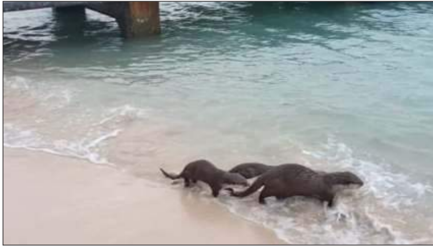
The otter mum with her cubs recently seen at Struisbaai.

Local reporter and Humane Society International – Africa